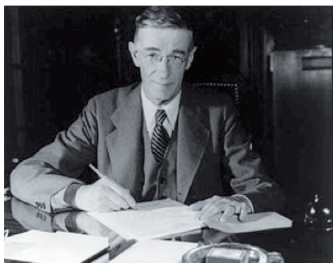
Fig. 1 - Vanevaar Bush dans les années quarante, alors qu'il était président du Conseil scientifique du Président Roosevelt. Fondateur de Raytheon en 1922.

La création d'une nouvelle Silicon Valley reste le Graal (inatteignable comme il se doit!) de cette politique locale 5 .